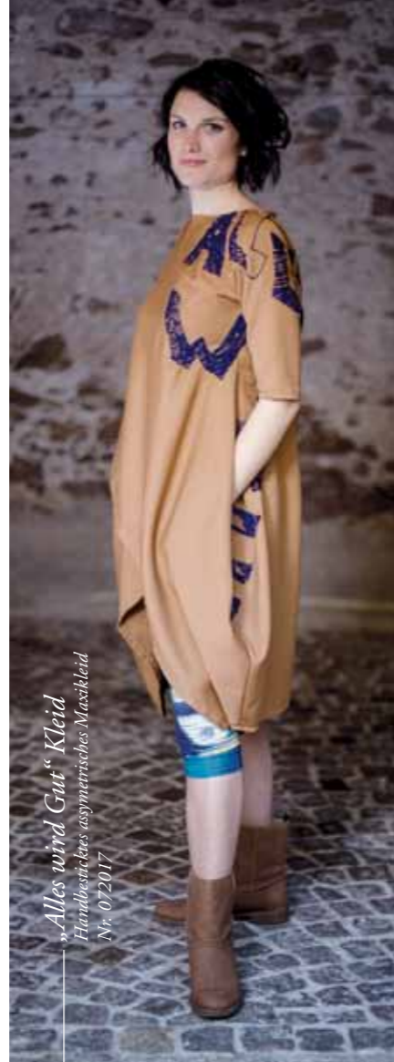
„Alles wird Gut“ Kleid Handbesticktes asymmetrisches Maxikleid Nr. 072017