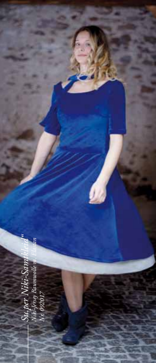
Su, per Niki-Samtkleid“ Niki-Jersey Baumwolle n. Elstan Nr. 092017