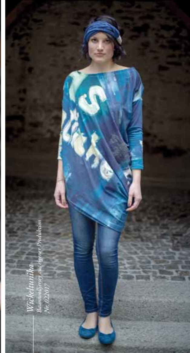
Wickelturnika Baumwolljersey aus eigener Produktion Nr. 022017