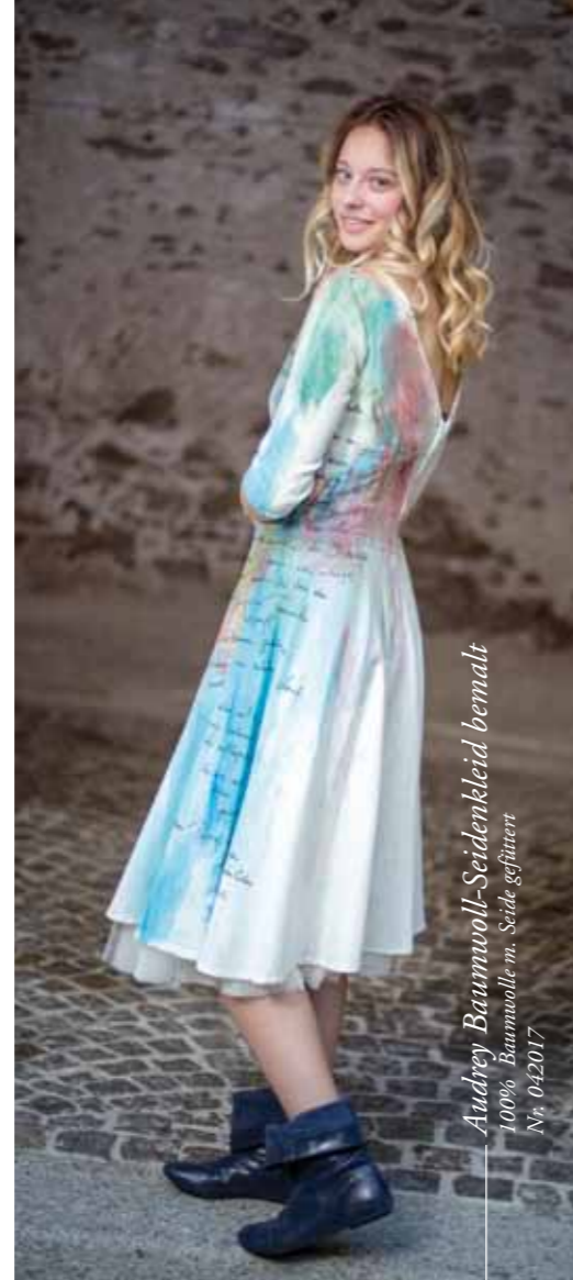
Audrey Baumwoll-Seidenkleid bemalt 100% Baumwolle m. Seide gefüttert Nr. 042017