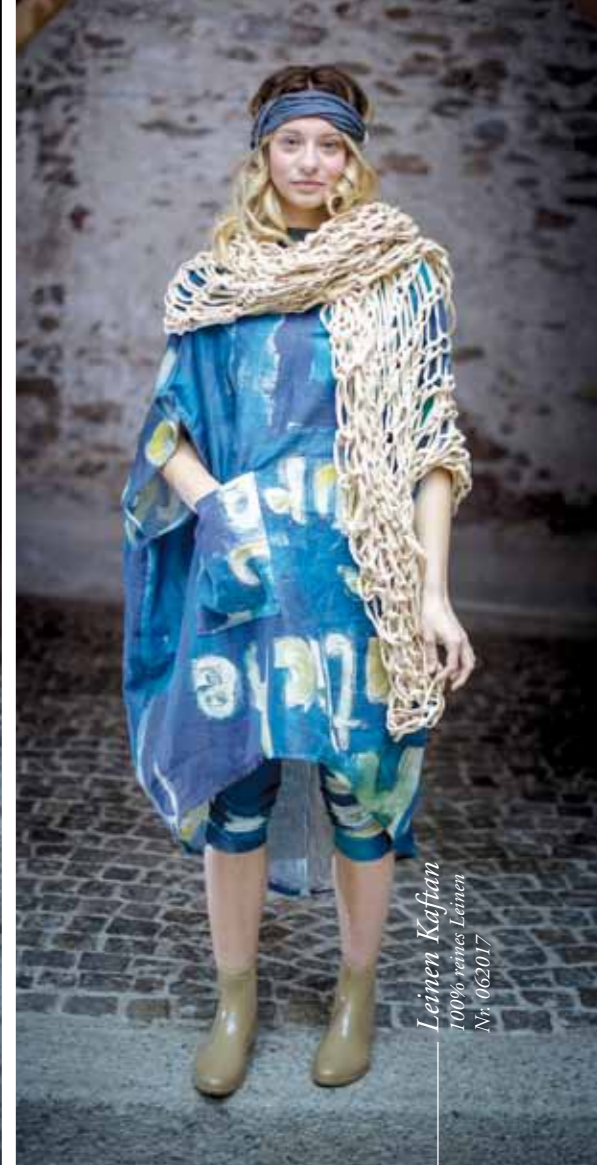
Leinen Kaftan 100% reines Leinen Nr. 062017