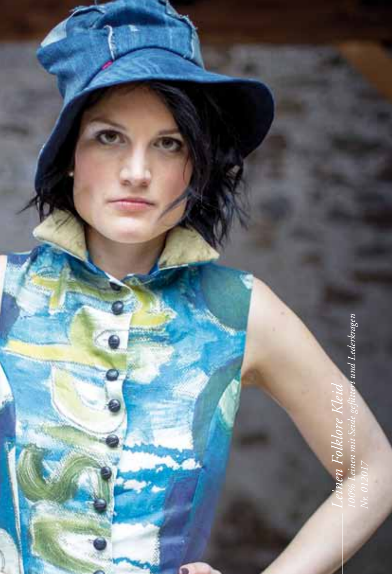
Leinen Folklore Kleid 100% Leinen mit Seide gefüttert und Lederkragen Nr. 012017