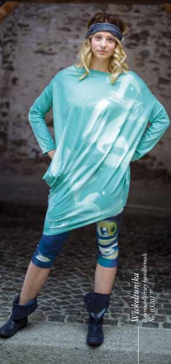
Wickeltrunika Baumwolljersey handbemalt Nr. 032017