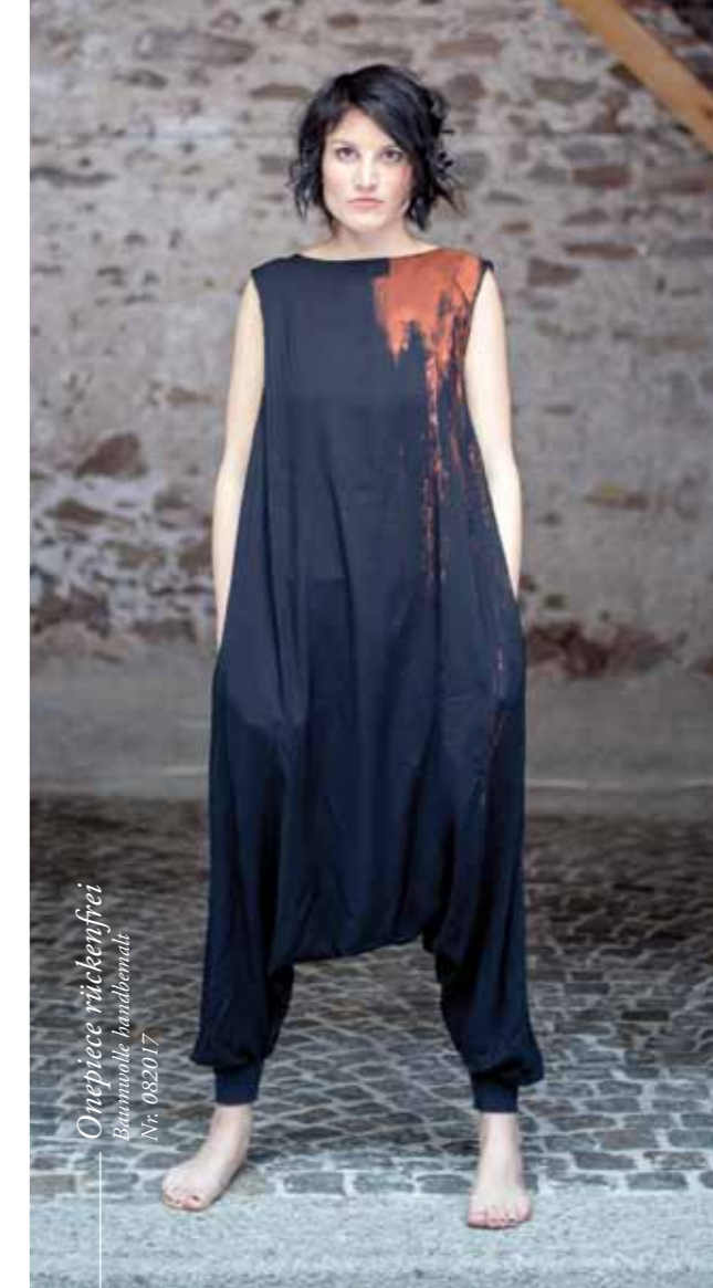
Onepiece rückenfrei Baumwolle handbemalt Nr. 082017