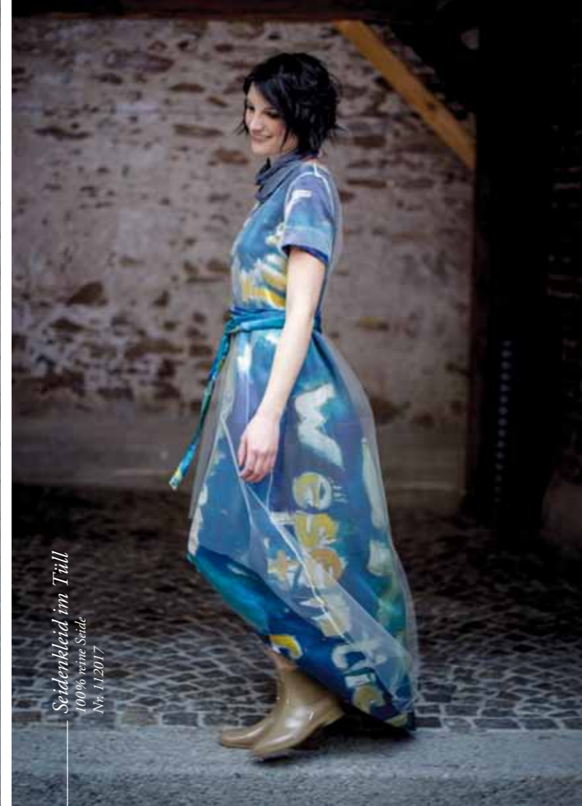
Seidenkleid im Tüll 100% reine Seide Nr. 112017