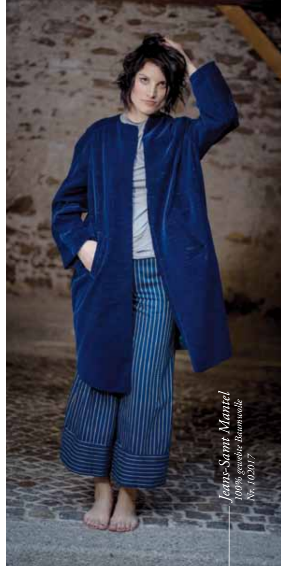
Jeans-Samt Mantel 100% gewebte Baumwolle Nr. 102017