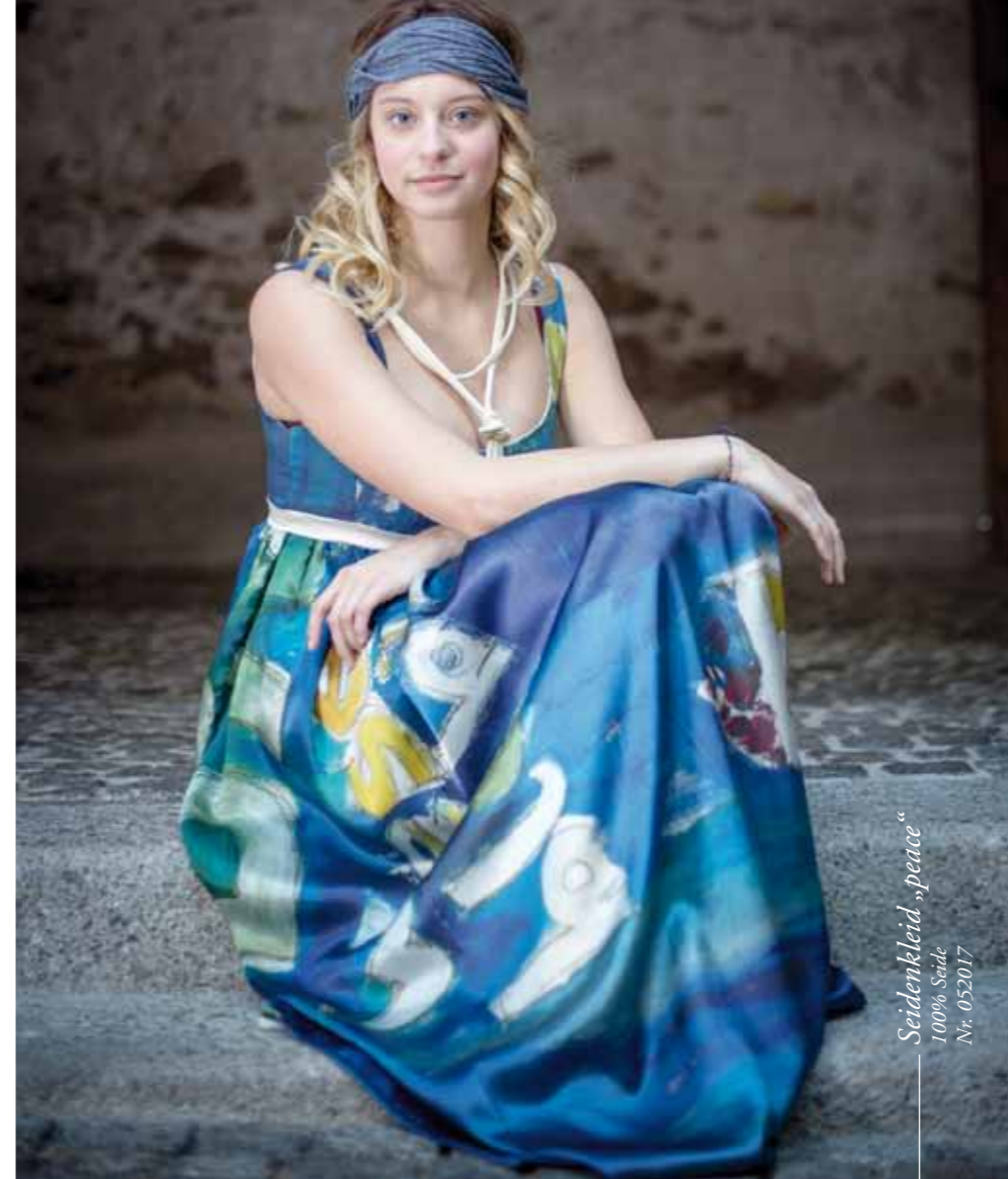
Seidenkleid „peace“ 100% Seide Nr. 052017